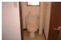
設置前。 古くて黄ばみもありました。

築25年のファミリー物件です。空室対策としてウォシュレットを設置しました。それまでご案内をしてもなかなかお申込みまで至りませんでした。設置後、「ウォシュレット付きは嬉しい」と申込に至るケースが増えました。女性（奥様）はトイレやキッチンなどはこだわりを強く持たれる傾向があり、「そこだけは譲れない」という方も少なくありません。