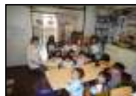
子供達の笑顔 は最高ですね