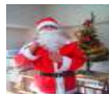
当社スタッフがサンタ として参加しました